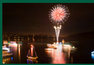
Desfile de luces Ver más en la página 1.

Haga clic aquí o escanee el código QR para escuchar el audio del boletín en Español