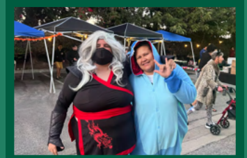
Lo más destacado de las vacaciones Ver más en la página 3.