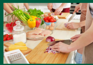
Clases de cocina Ver más en la página 2.